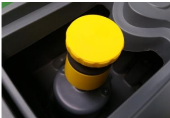
폐수탱크의 개구부가 넓어 탱크 청소 및 필터관리가 용이