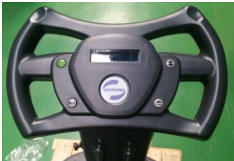
간편한 조작버튼으로 누구나 손쉽게 작동 가능