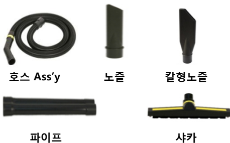
호스 Ass'y 노즐 칼형노즐 파이프 샤크